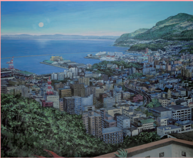
残照～街を撫でる静かな風を月が見ていた