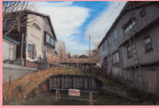
会友賞・新会員 草刈喜一郎 2018. U市役所の裏で