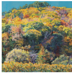
会友賞 大石 春夫 季節のない山