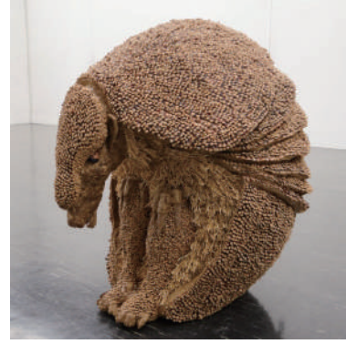
第16回 道展 U21大賞 ジロの懸念

あらためて、制作を支えてくれた家族、先生、友達、そしてジロを選んでくれた審査員方々に感謝です。