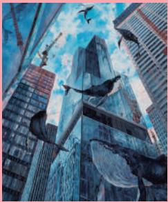
新会友 晴朗回顧 城内つばら