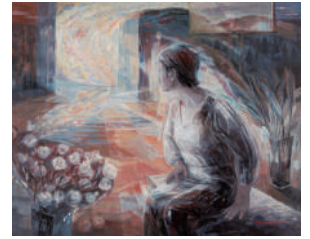
会友賞 照井まゆみ 彼方から