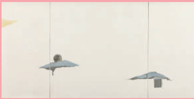
会友賞 大泉 力也 memory lane