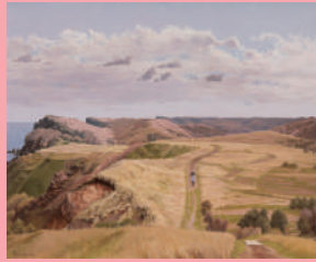
新会友 岬へ 田澤 栄二