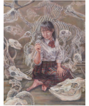
第16回 道展 U21準大賞 命の輪郭