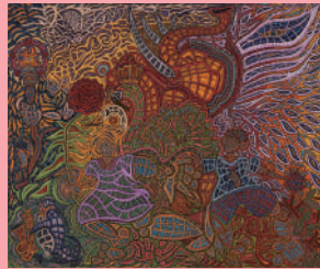
新会友 狂愛夜行 丸山 裕也